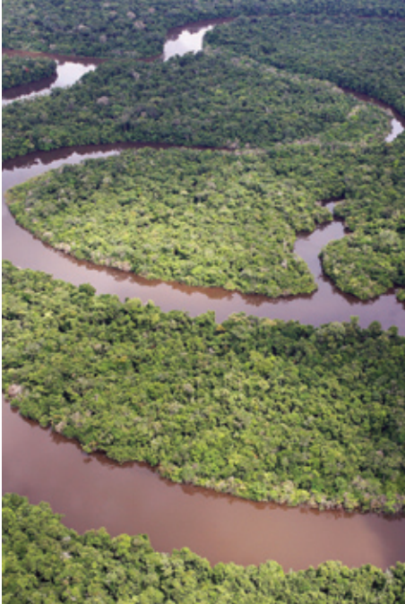
Amazon rainforest, Loreto region, Peru

Les aires protégées apportent d'ores et déjà une contribution cruciale à l'atténuation du changement climatique et aux adaptations nécessaires. Mais leur potentiel n'est encore qu'en partie réalisé et leur intégrité reste menacée ; en effet, des études montrent que, si les systèmes d'aires protégées ne sont pas parachevés et gérés efficacement, elles seront trop fragiles pour résister au changement climatique, et ne contribueront pas aux stratégies de réponses nécessaires. Accroître la superficie, la couverture, la connectivité, la restauration de la végétation,