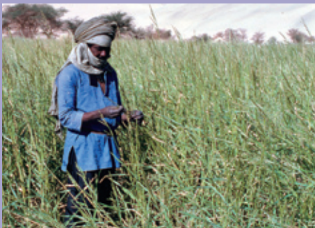
Relic stand of wild sorghum North Aïr, Niger