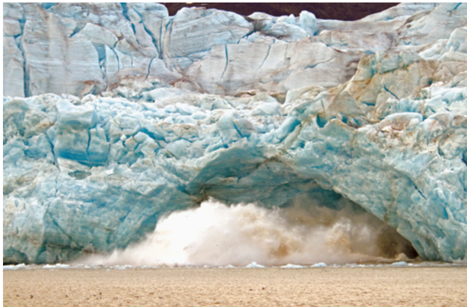
Glacier carving, Spitsbergen, Norway