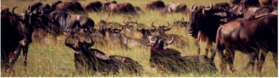
The grasslands of Serengeti National Park, Tanzania

modalités de gestion. La prise en compte des possibilités de limiter les catastrophes donnera une impulsion supplémentaire à l'extension des aires protégées, en particulier en montagne, dans les zones où les pentes sont très escarpées et dans les zones humides côtières et intérieures.