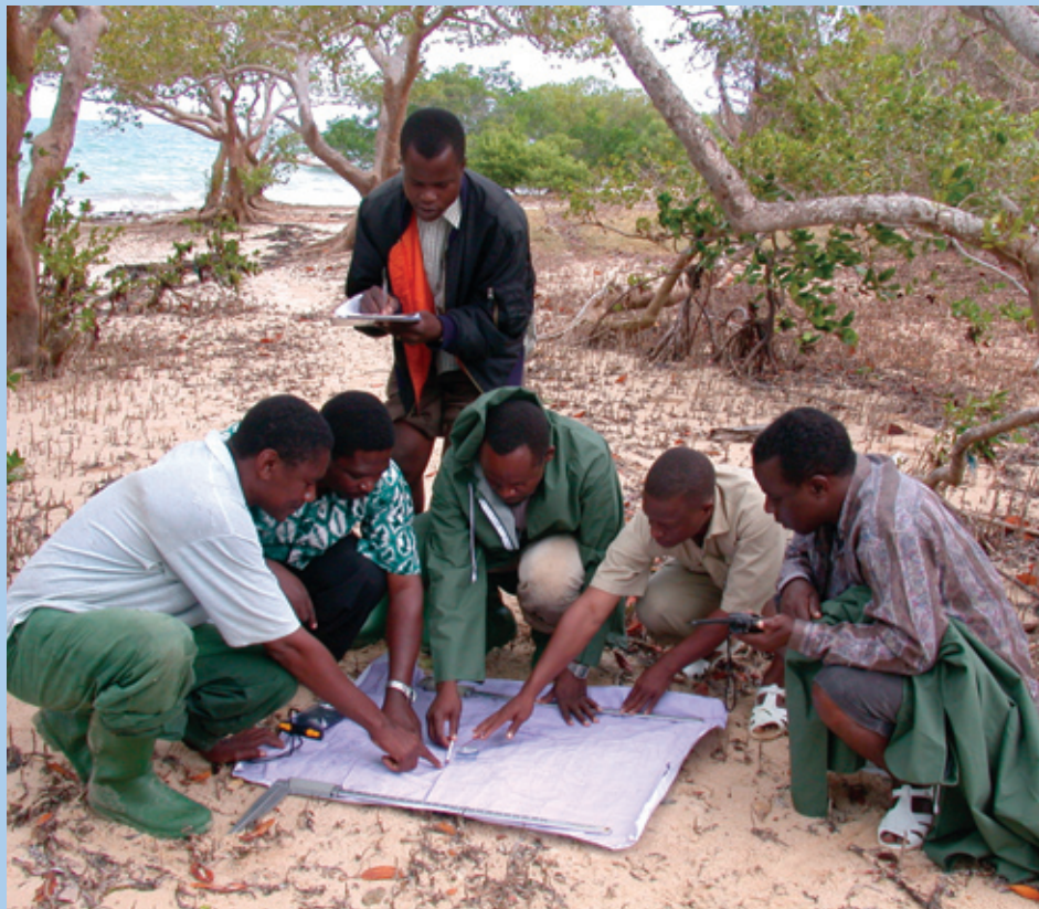
Mangrove monitoring. Mafia Island, Tanzania

Malheureusement, les co-bénéfices générés pour le climat, la biodiversité et la société ne sont souvent pas tenus en compte ou ignorés. Ce livre articule clairement, pour la première fois, comment les aires protégées contribuent à réduire substantiellement l'impact des changements climatiques et ce qu'il faudrait pour qu'elles jouent encore mieux ce rôle. Au moment où nous nous engageons dans des négociations sans précédent sur le climat et la biodiversité, il est essentiel que ces messages soient bien compris des décideurs et contribuent à l'élaboration de politiques et de mécanismes de financement efficaces.