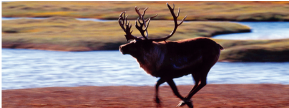
Caribou ( Rangifer tarandus ) running on the tundra, Kobuk Valley National Park, Alaska, USA