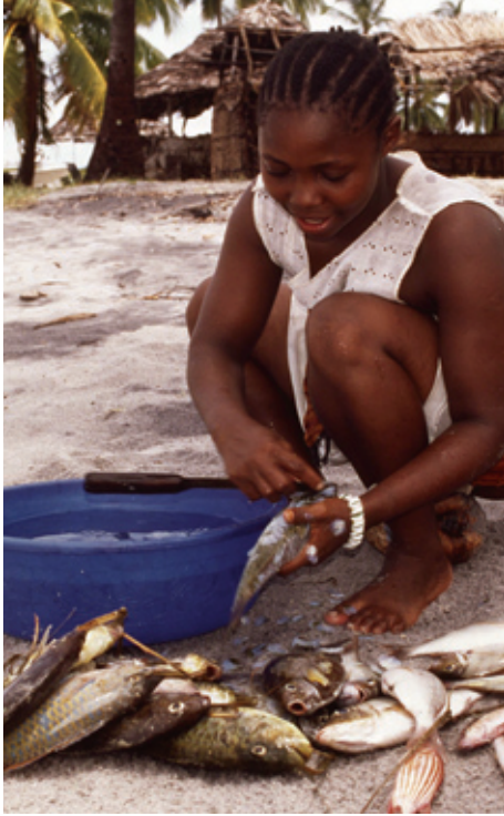
Subsistence fishing Mafia Island Marine Park, Tanzania

services especially through protected area systems at the landscape/seascape scale