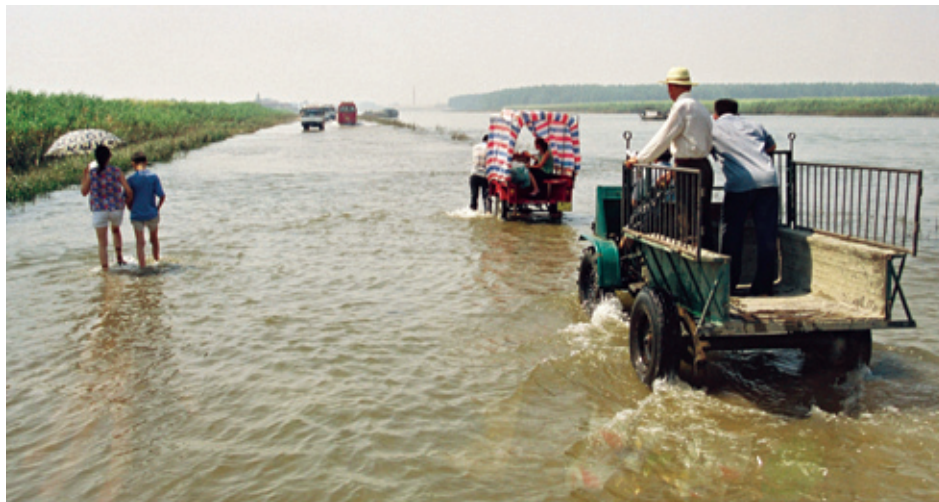
Flooding in East Dongting Lake, Hunan Province, China

Protected areas are already providing vital climate change mitigation and adaptation benefits. But their potential is still only partially realised and their integrity remains at risk; indeed research shows that unless protected area systems are completed and effectively managed they will not be robust enough to withstand climate change and contribute positively to response strategies. Increasing protected area size, coverage, connectivity, vegetation restoration, management effectiveness and inclusive governance would enable a scaling up of the potential of the global protected areas system as a solution to the challenge of climate change and as a model for other resource management programmes. Two issues are critical: