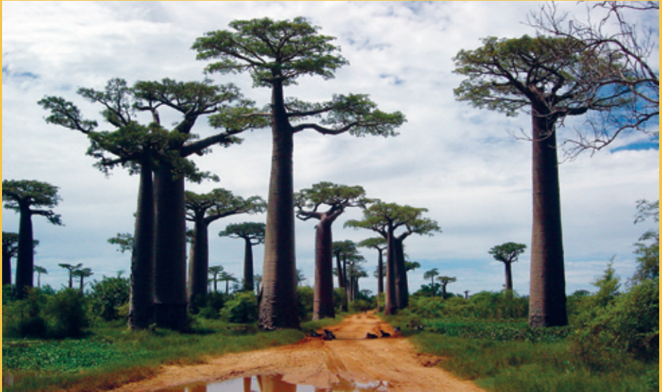
Valley of baobab trees, Madagascar

Opportunities to use protected areas in climate response strategies need to be prioritised by national and local governments. At a global level, the Convention on Biological Diversity's (CBD) Programme of Work on Protected Areas should be deployed as a major climate change mitigation and adaptation tool. The role of protected areas as part of national strategies for supporting climate change adaptation and mitigation should also be recognised by the UN Framework Convention on Climate Change (UNFCCC). This means: