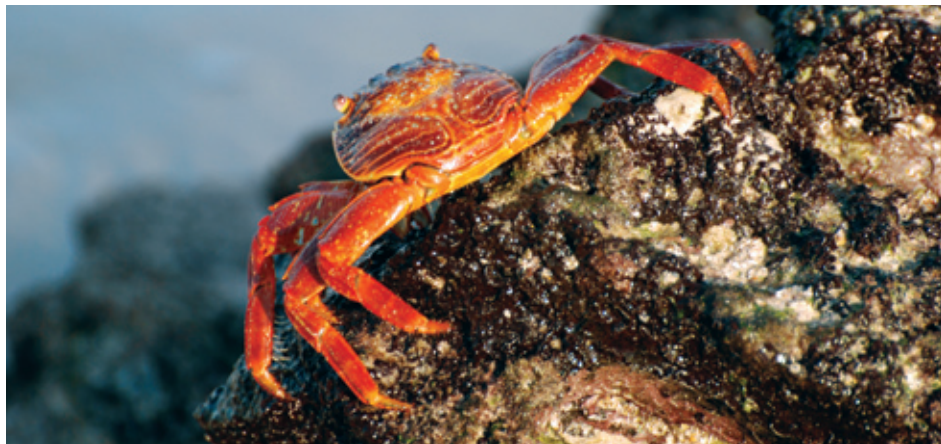
Sally Lightfoot Crab ( Grapsus grapsus ), Galapagos