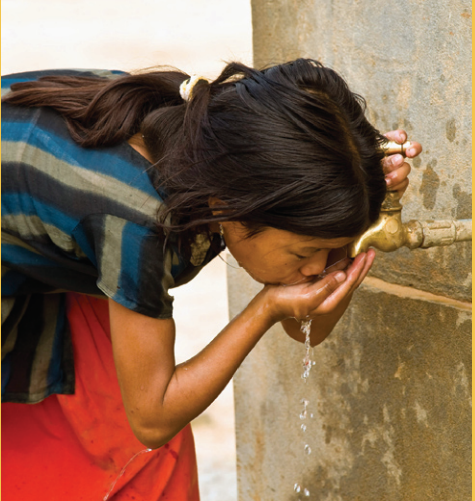
Local spring water in Nepal

is needed for them to achieve even more. As we enter an unprecedented scale of negotiations about climate and biodiversity it is important that these messages reach policy makers loud and clear and are translated into effective policies and funding mechanisms.