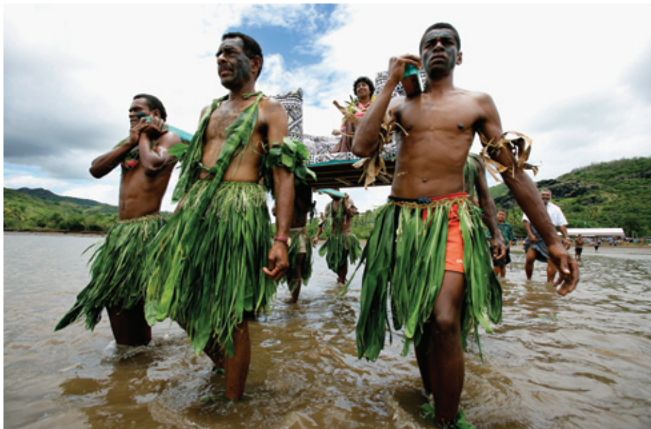
Fijian men celebrating the creation of a new marine protected area