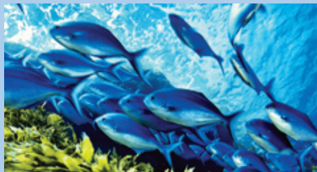
School of blue maomao fish ( Scorpius violaceus ), Poor Knights Islands, New Zealand

qui bénéficient d'un cadre législatif, politique et institutionnel clair, de connaissances, de ressources et d'un personnel établi. Les aires protégées contiennent les seuls habitats naturels de grandes superficies dans de nombreuses régions. Il est possible de mieux les relier aux échelles régionales et continentales et de les gérer plus efficacement de manière à augmenter la capacité des écosystèmes à résister aux changements climatiques et à préserver les services vitaux qu'ils nous offrent.