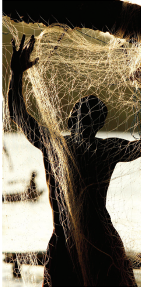
Fisherman hanging nets up to dry, Papua New Guinea

Les aires protégées bien gérées peuvent offrir une solution d'un bon rapport coût-efficacité pour la mise en œuvre de stratégies de réponse aux changements climatiques, étant donné que les coûts de mise en place sont déjà amortis et que les coûts socio-économiques sont compensés par les autres services rendus par les aires protégées. L'efficacité des aires protégées est maximale quand elles ont une bonne capacité et une gestion adéquate, quand un accord sur leur gouvernance a été conclu et quand elles bénéficient d'un appui résolu de la population locale et résidente. Idéalement, les aires protégées et les besoins en matière de conservation devraient être intégrés dans des stratégies plus vastes sur les milieux terrestres et marins.