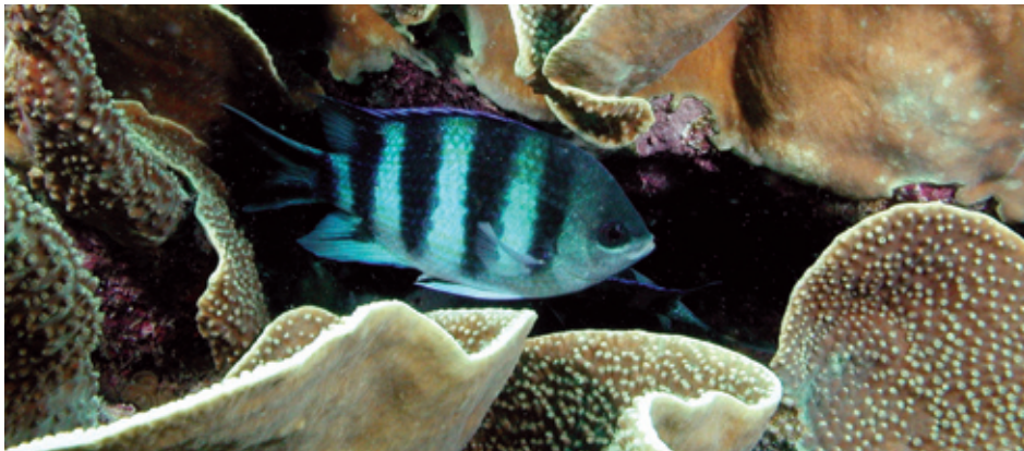
Damselfish laying eggs in coral colonies, Fiji

Las áreas protegidas ya son beneficiosas en términos de mitigación y adaptación. Pero sólo se está aprovechando parcialmente su potencial y su integridad está en peligro, varias investigaciones muestran que sin avances y sin una gestión más eficaz de las áreas protegidas, no serán lo bastante robustas como para resistirse al cambio climático y contribuir de forma positiva a las estrategias de respuesta. Aumentando el tamaño, el alcance, las conexiones, la restauración vegetal, la eficacia de la gestión e incluso de la gobernanza de las áreas protegidas se podría ampliar el potencial del sistema global de áreas protegidas como solución al reto del cambio climático y como modelo para otros programas de gestión de los recursos. Sin embargo existen dos problemas críticos: