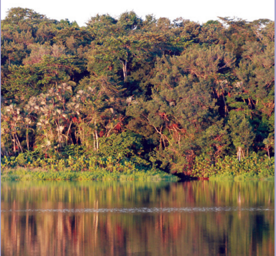
Yasuni National Park, Ecuador

articula claramente como las áreas protegidas contribuyen significativamente a reducir los impactos del cambio climático y que se necesita para alcanzar aún más. Mientras entramos en una escala de negociaciones sin precedentes sobre el clima y la biodiversidad es importante que estos mensajes alcancen, de forma alta y clara, a los políticos y así sean transformados en políticas y mecanismos de financiación efectivos.